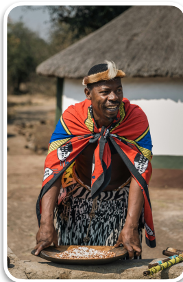
Vila Cultural Lesedi

Para este roteiro não é necessário nenhum visto. É necessário Comprovante Internacional da vacina da Febre Amarela. O Passaporte deve ter validade mínima até Abril de 2026.